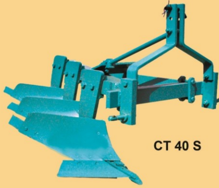
CT 40 S